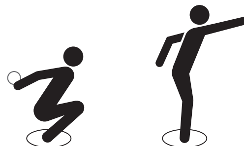
[図2/アンダースロー]