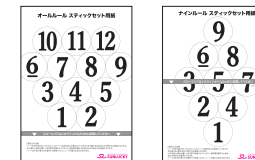
表: ナインルール用 裏: オールルール用 ※テンルールは使用しない。